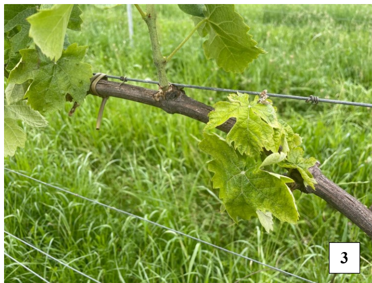
Figure 1,2,3 – Sintomi di flavescenza dorata su foglia, grappolo e germoglio.