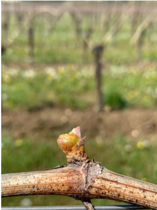
Fig. 5: BBCH 8