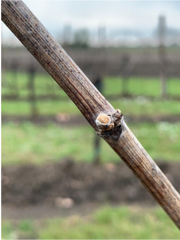
Fig. 1: BBCH 4