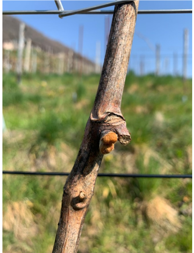
Fig. 2: BBCH 5