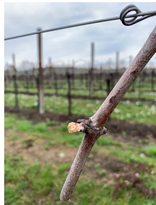
Fig. 4: BBCH 7