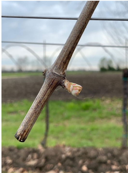
Fig. 6: BBCH 9