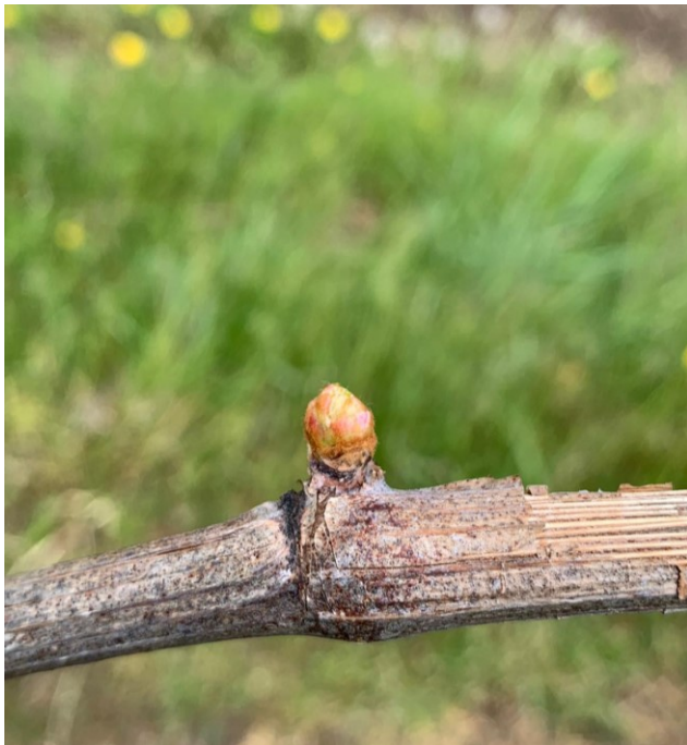
Fig. 3: BBCH 6